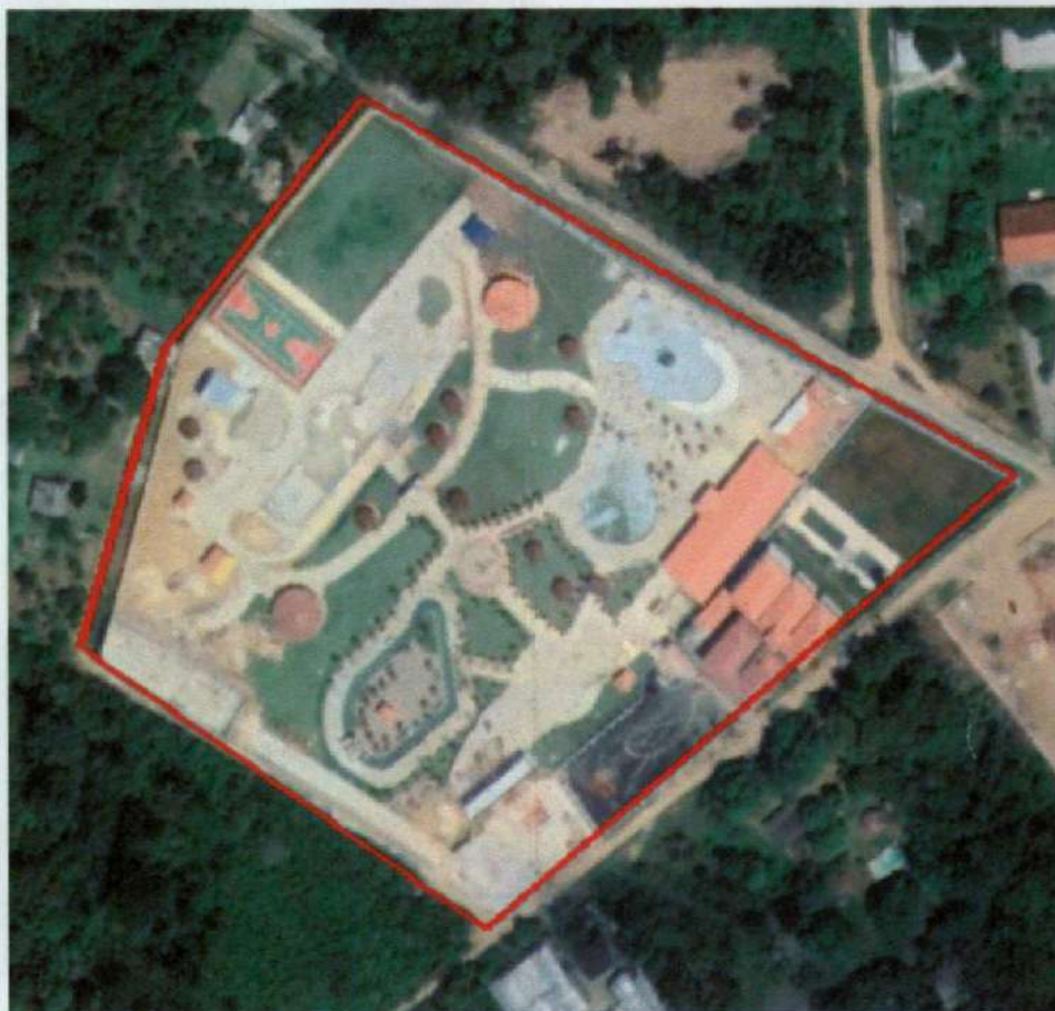
Imagem de 02/2018 Na data de 02/2018

Conforme visualizado nas imagens acima informo que: