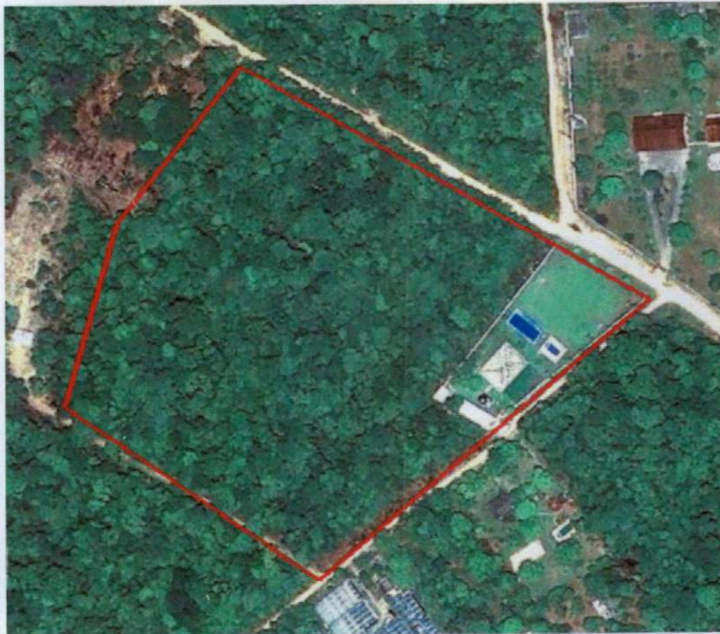
Imagem de 10/2009

Adicionalmente foi realizada análise através do software Google Earth para verificar quanto ao ano de instalação do empreendimento, conforme pode ser verificado nas imagens a seguir: